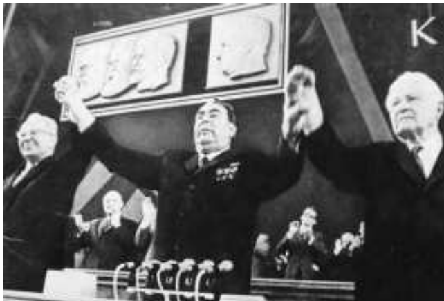
Gustáv Husák, Leonid Iljič Brežněv a Ludvík Svoboda

Vedoucí představitelé řady bratrských zemí — členů Varšavské smlouvy — se rozhodli, věrní zásadám internacionalismu a vycházející z pocitu solidarity s bratrským Československem a z odpovědnosti za osudy socialismu v Evropě, svolat společnou schůzku s vedoucími činiteli ČSSR a v soudružském duchu projednat situaci, jež se vytvořila, najít řešení a nabídnout pomoc. Vedoucí činitelé KSČ bohužel tento návrh nepřijali a do Varšavy nepřijeli. Situace však byla taková, že ke svolání takové schůzky s bratrskými stranami byly všechny politické i morální důvody.